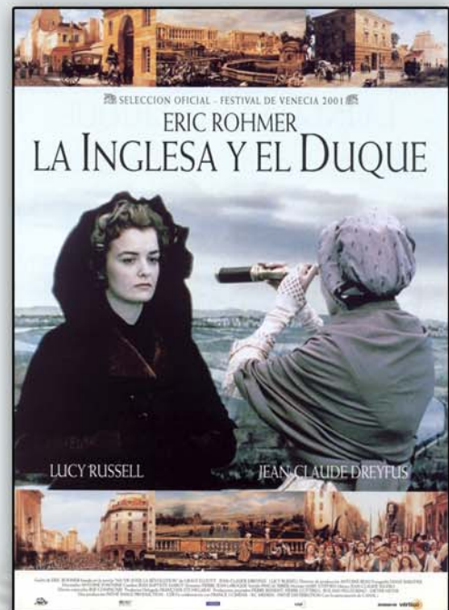
La inglesa y el duque Eric Rohmer. 2001