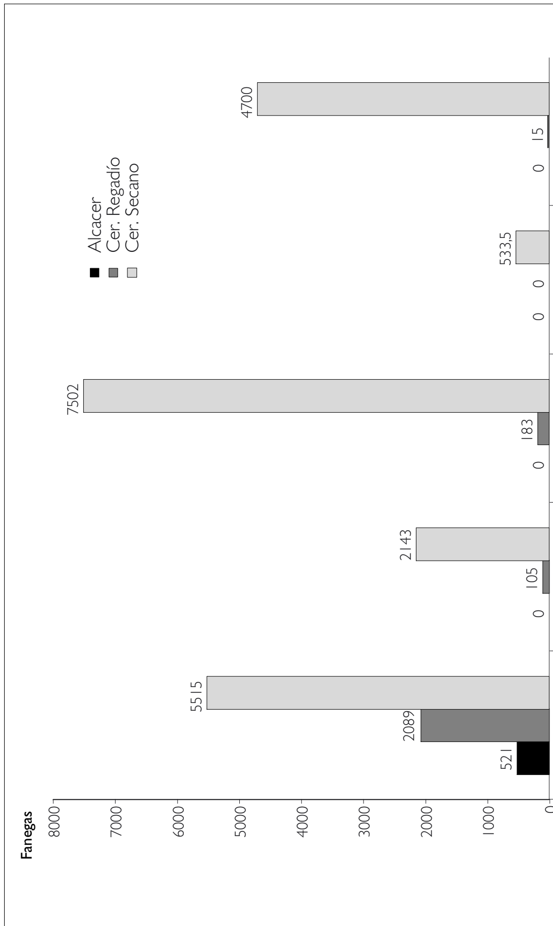
Fig. 2. Repartimiento de tierras de regadío y secano de 1489 a 1492, según el L.R.L.