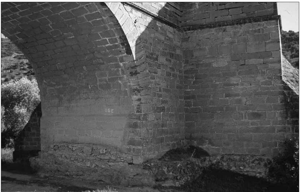
Fig. 6. Base del arco principal.