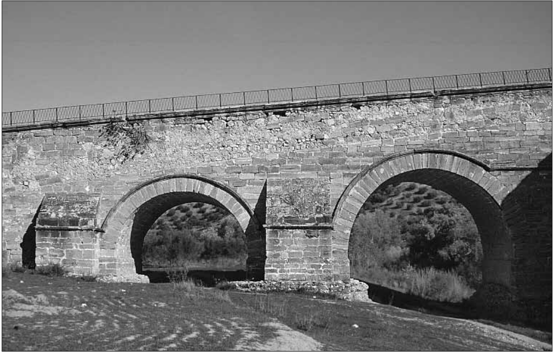
Fig. 5. Arcos situados al Norte.