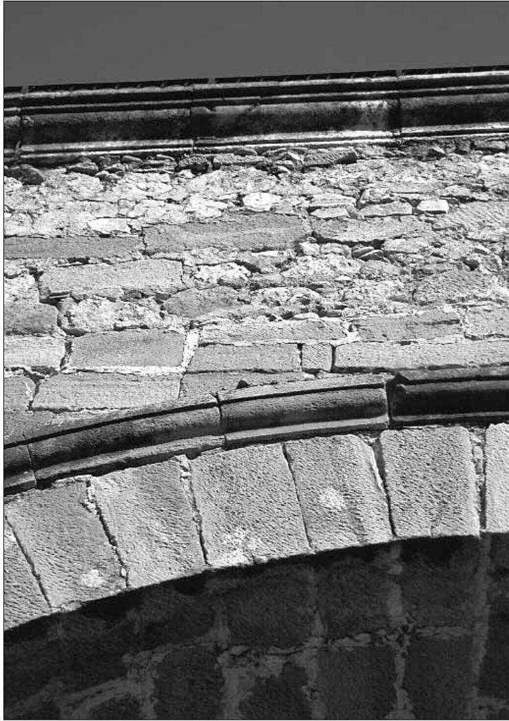
Fig. 7. Detalle del dovelaje.