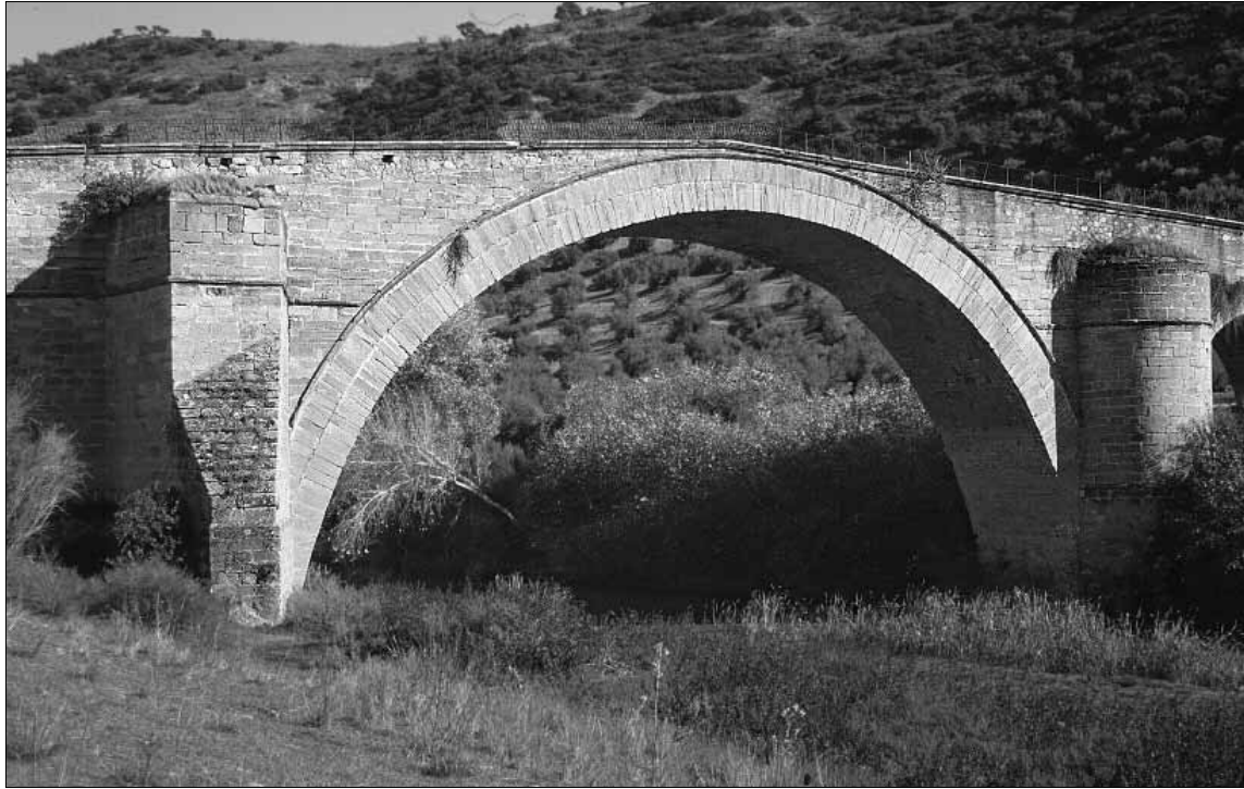
Fig. 3. Arco principal.