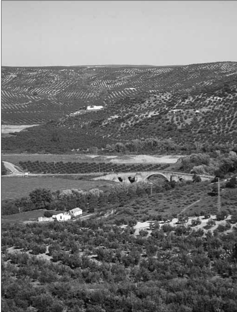
Fig. 1. Emplazamiento del puente de Ariza desde el Sudoeste.