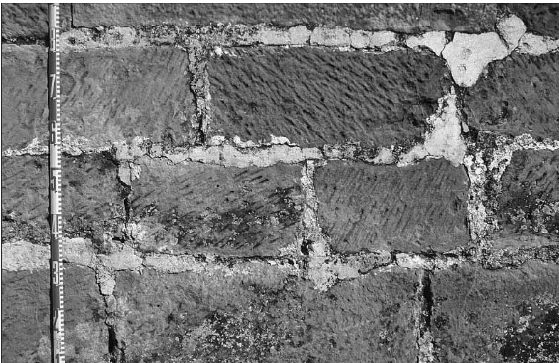
Fig. 8. Detalle del aparejo.