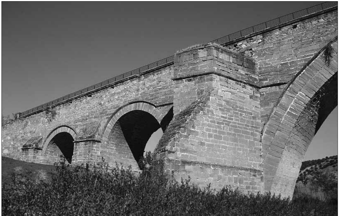
Fig. 4. Vista desde el Sudoeste.