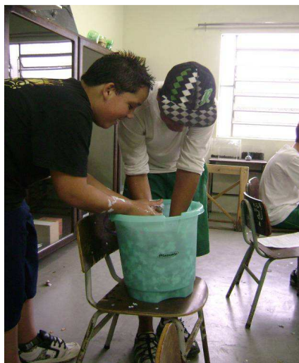
Figura 2. Em outra etapa da reciclagem, os alunos molham o papel (Oliveira, 2010)

Vygotsky (1984) salienta que o caráter sociocultural do ensino e da aprendizagem faz-se presente na mediação, onde o aprendiz depende inevitavelmente de outros atores, como colegas e professores principalmente. Uma das funções do professor é ser o parceiro mais capaz, que atua na condução do processo de ensino e orienta a aprendizagem do estudante por meio de interações sociais adequadamente planejadas (REIS, 2008). Pode-se dizer que as atividades desenvolvidas na reciclagem de papel por meio das atividades em grupo promovem esta interação social, favorecendo a aprendizagem.