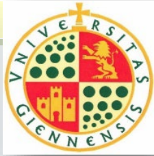
Sesión ordinaria n.º 96 Pleno Consejo Social

La aprobación de estas Memorias de verificación, por ambos órganos universitarios, garantiza que los programas cumplen con los requisitos de calidad y normativa académica establecidos . Igualmente, refleja el compromiso de la UJA con la excelencia académica, la transparencia y la calidad en la formación de su alumnado , así como su voluntad de avanzar en la modernización y adopción de sus programas a los estándares nacionales e internacionales.