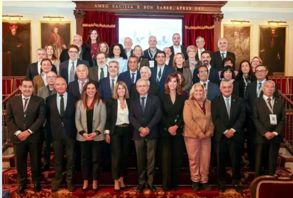
Foto de familia, presidentes y secretarios de los Consejos Sociales con los ponentes de la mesa inaugural

La transferencia de conocimiento de las universidades a la sociedad ha sido el tema central de estas jornadas, celebradas en Valencia, un encuentro para analizar los desafíos y oportunidades de la conexión entre universidad, empresa y sociedad en un momento decisivo para el sistema universitario español. La cita ha tenido lugar en el Centro Cultural La Nau y en la Fundación ADEIT , bajo la coordinación del Consejo Social de la Universidad de Valencia y la colaboración del Consejo Social de la Universidad Politécnica de Valencia .