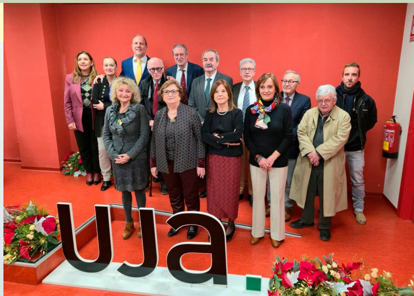
El Rector acompañado de los catedráticos eméritos reconocidos