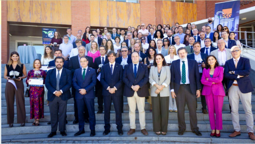
Foto organizadores, premiados y participantes.