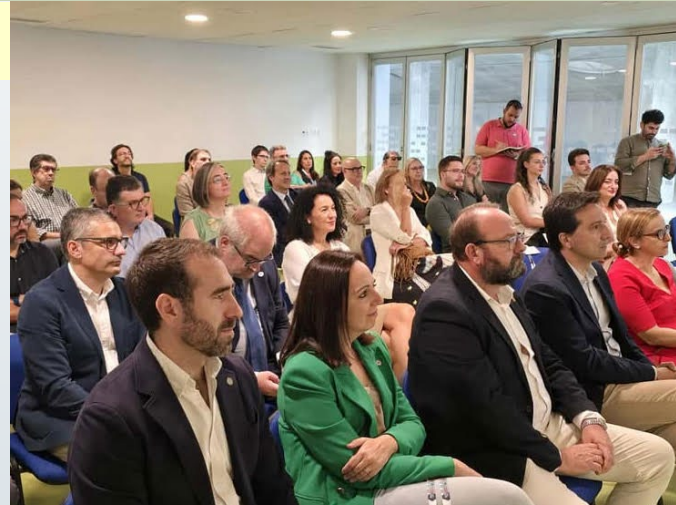
Asistentes al acto de inauguración del CFID