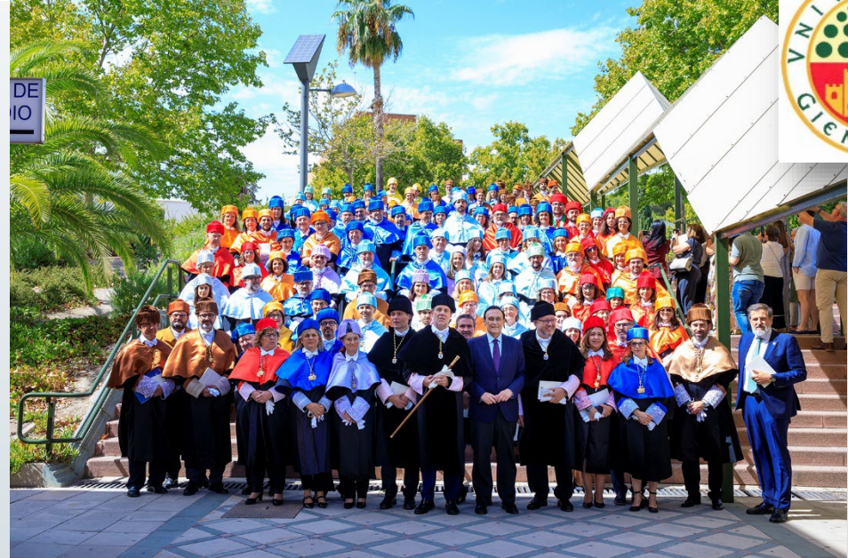
El Presidente del Consejo Social, junto al Rector, Autoridades académicas y los nuevos Doctores/as