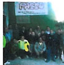
PASSO quiere catalogar el barrio como 'universitario'