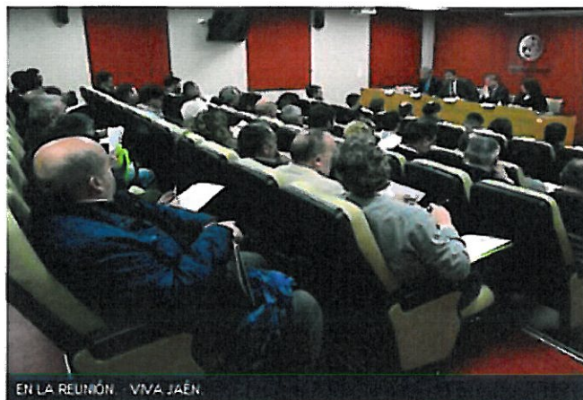
EN LA REUNIÓN. VIVA JAÉN.