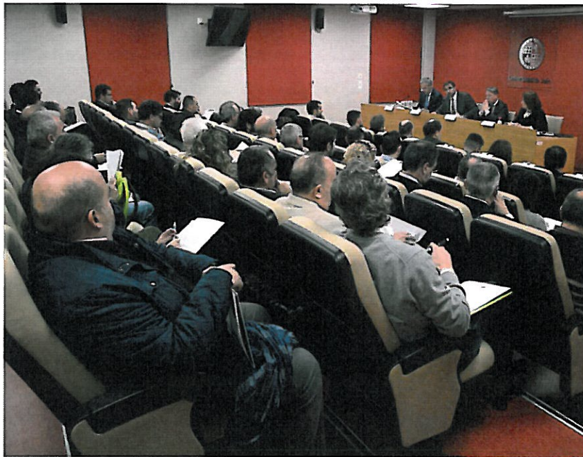
Reunión informativa con empresarios. VIVA JAÉN

El propósito es establecer nexos de unión entre la Universidad y las empresas que operan en la provincia, configurándose como un foro cualificado de encuentro e impulso de proyectos entre