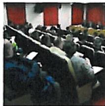
La Fundación UJA-Empresa echa a andar y abre el plazo

También promoverá el empleo con acciones que faciliten la iniciación profesional e inserción laboral de egresados y estudiantes universitarios. En cuanto a la innovación, se realizarán actividades con el asesoramiento en I+D+i y foros de debate sobre las necesidades en esta materia y acciones de difusión y sensibilización, así como de asesoramiento y apoyo en la puesta en marcha de proyectos empresariales. "La Fundación es un foro en el que nos vamos a sentar ambas partes para cumplir los objetivos. Un puente entre el empresariado y lo que hace la Universidad", dijo Gómez.