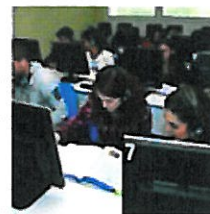
El máster saca lo mejor del estudiante