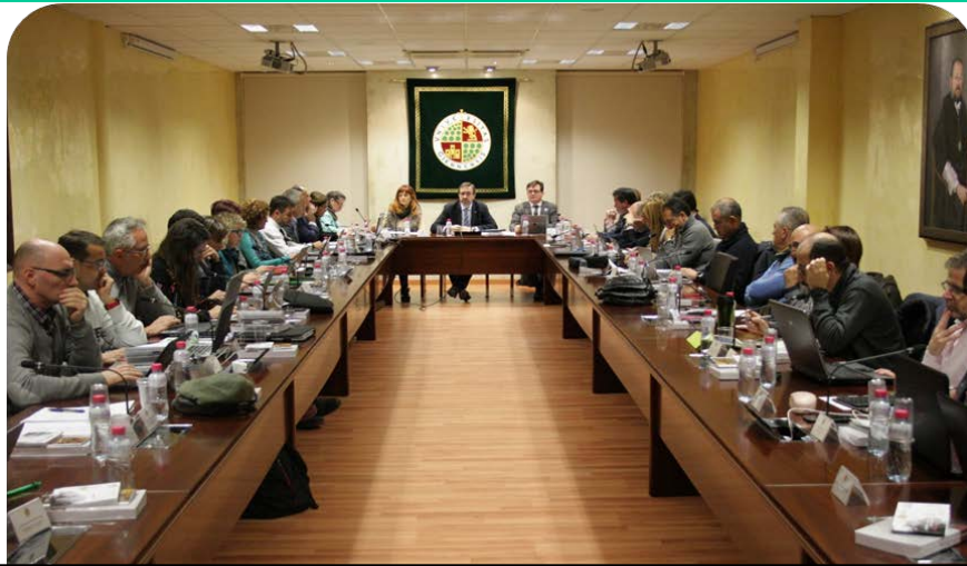
Sesión nº 37 del Consejo de Gobierno UJA. 24/07

El Consejo Social participó en esta sesión en las que se adoptaron, entre otros acuerdos: Aprobar la ampliación de la oferta de plazas en el Programa de Doctorado en Derecho de la UJA; Aprobar los horarios para el curso 2018/2019; Aprobar las Guías Docentes para el curso 2018/2019; Aprobar el Plan de Organización docente para el curso 2018-2019; Aprobar la Memoria Académica correspondiente al curso 2016/2017; Aprobar la cesión de uso de espacios en el Campus Científico Tecnológico de Linares a favor de la Delegación Territorial de Educación, por un periodo de cuatro años, para la implantación de módulos formativos de grado superior autorizados en el IES Reyes de España.