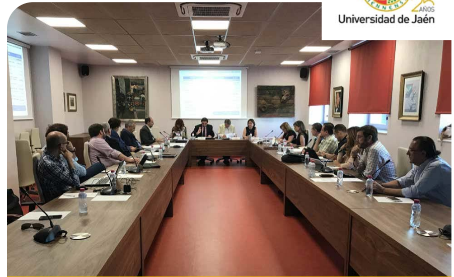
Sesión nº 59 del Pleno Consejo Social UJA. 25/06

El Consejo Social participó en esta sesión en la que, entre otros, se adoptaron los siguientes acuerdos: Aprobar la solicitud de informe previo de la propuesta de Máster Universitario en Urgencias, Emergencias y Cuidados Críticos en Enfermería, dirigida a la Secretaría General de Universidades e Investigación; Aprobar las nuevas propuestas de Diplomas de Especialización y Másteres Propios para su implantación en el primer cuatrimestre del curso 2018-2019; Aprobar el Plan de Cooperación para el Desarrollo 2018- 2020 de la Universidad de Jaén; Informar y elevar al Consejo Social para su aprobación, las Cuentas Anuales del ejercicio 2017 de la UJA