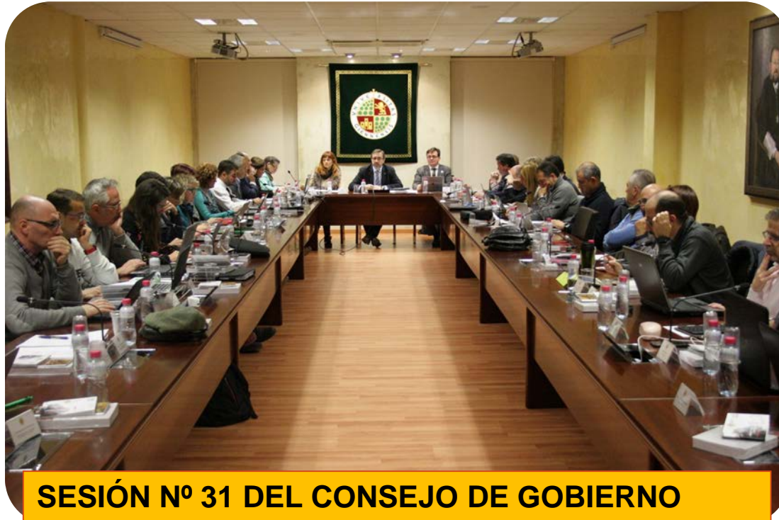
SESIÓN Nº 31 DEL CONSEJO DE GOBIERNO