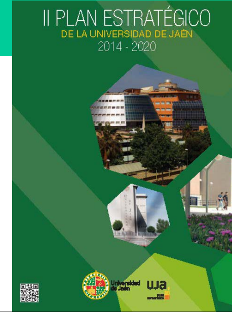
Comité Director del Plan Estratégico de la UJA. 25/07

El Consejo Social participó en esta sesión en las que se adoptaron, entre otros acuerdos: Aprobar la ampliación de la oferta de plazas en el Programa de Doctorado en Derecho de la UJA; Aprobar los horarios para el curso 2018/2019; Aprobar las Guías Docentes para el curso 2018/2019; Aprobar el Plan de Organización docente para el curso 2018-2019; Aprobar la Memoria Académica correspondiente al curso 2016/2017; Aprobar la cesión de uso de espacios en el Campus Científico Tecnológico de Linares a favor de la Delegación Territorial de Educación, por un periodo de cuatro años, para la implantación de módulos formativos de grado superior autorizados en el IES Reyes de España.