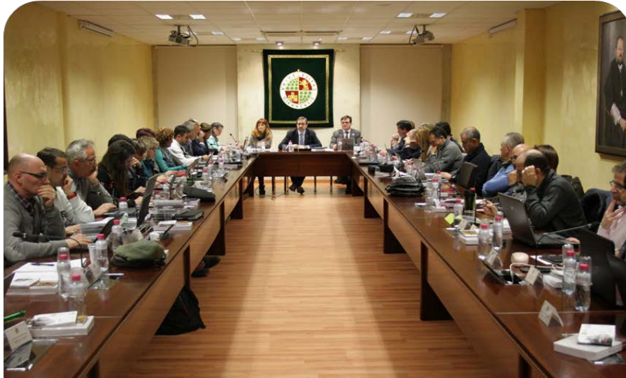
Sesión nº 36 del Consejo de Gobierno UJA. 25/06

El Consejo Social participó en esta sesión en la que, entre otros, se adoptaron los siguientes acuerdos: Aprobar la solicitud de informe previo de la propuesta de Máster Universitario en Urgencias, Emergencias y Cuidados Críticos en Enfermería, dirigida a la Secretaría General de Universidades e Investigación; Aprobar las nuevas propuestas de Diplomas de Especialización y Másteres Propios para su implantación en el primer cuatrimestre del curso 2018-2019; Aprobar el Plan de Cooperación para el Desarrollo 2018- 2020 de la Universidad de Jaén; Informar y elevar al Consejo Social para su aprobación, las Cuentas Anuales del ejercicio 2017 de la UJA