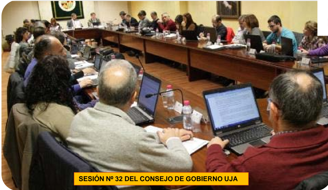
SESIÓN Nº 32 DEL CONSEJO DE GOBIERNO UJA