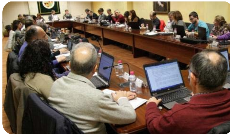
Sesión ordinaria nº 34 y sesión extraordinaria Nº 35 del Consejo de Gobierno UJA

El Consejo Social participó en ambas sesiones en la que se adoptaron, entre otros, los siguientes acuerdos: Aprobar el reconocimiento como Spin-off de la UJA a favor de la empresa basada en el conocimiento BIG DATA HEALTH TECHNOLOGY, S.L; Aprobar la pertenencia de la UJA a la Red Iberoamericana de Universidades y Centros Académicos de Investigación, Innovación, Desarrollo Tecnológico y Transferencia del Conocimiento Municipal; Aprobar la Normativa de Matricula para el curso 2018/2019, en Titulaciones de Grado, Máster y Doctorado en la UJA; Aprobar el Calendario Académico para el curso 2018/2019; Aprobar la oferta de bilingüismo para el curso 2018/2019 ( Sesión ordinaria nº 34 ). Aprobar los perfiles y tribunales de Plazas de Cuerpos Docentes Universitarios correspondientes a la oferta de Empleo Público 2018 ( Sesión extraordinaria nº 35 ).