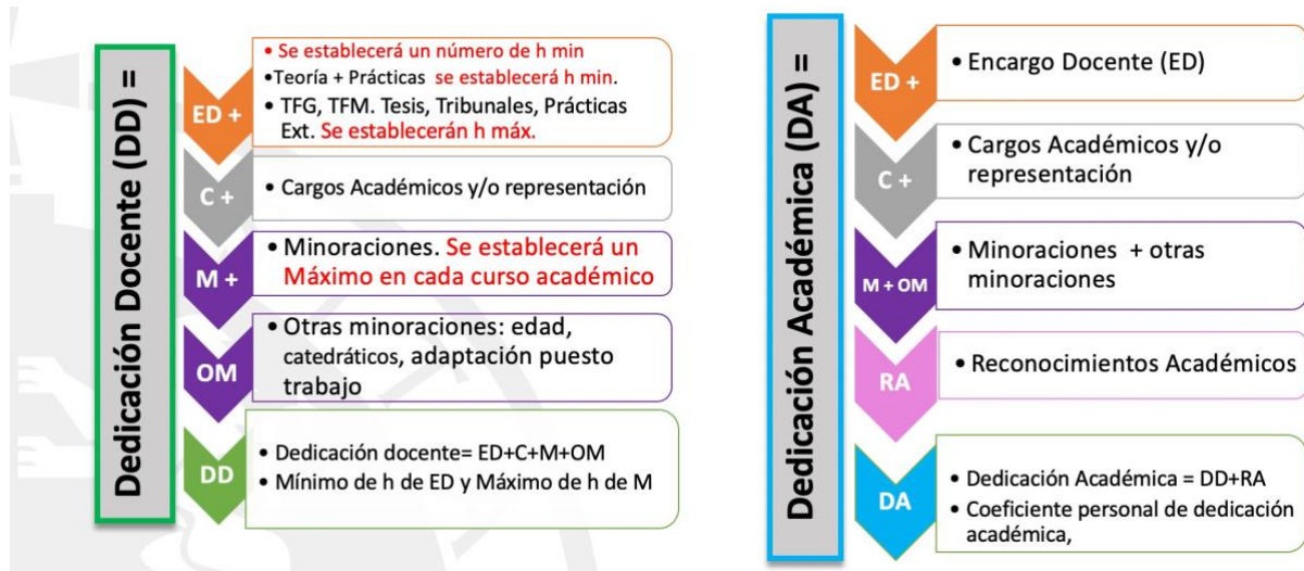
Fig. 1 Dedicación docente y dedicación académica