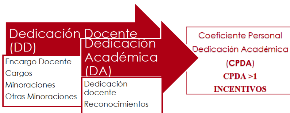
Fig. 2 Nuevo Modelo de Dedicación Académica