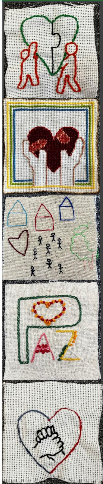
Boroados donados para la Exposición Cartografías Textiles El Calro, 2026