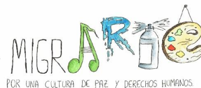
Fig. 1. Diseño inédito

Centro de interpretación de las Caras de Bélmez. C/ Alonso Vega, nº 2. Bélmez de la Moraleda. (Jaén). Mayo de 2025.