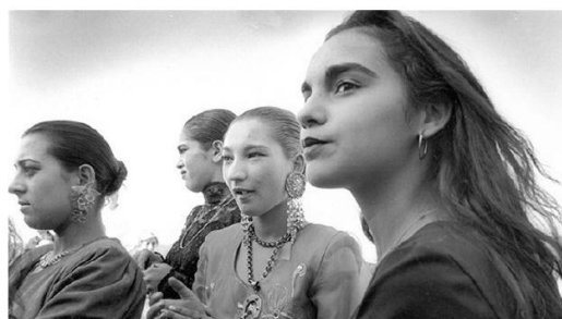
Niñas gitanas en Fregenal de la Sierra (Badajoz) Cristina García Rodero

Estudiantado de los ciclos de infantil y primaria, comunidad gitana de la provincia de Jaén, alumnado del Grado de Educación Infantil y Grado de Educación Primaria de la UJA.