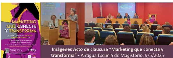
Imágenes Acto de clausura "Marketing que conecta y transforma" - Antigua Escuela de Magisterio, 9/5/2025