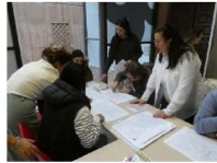
Lego Serious Play