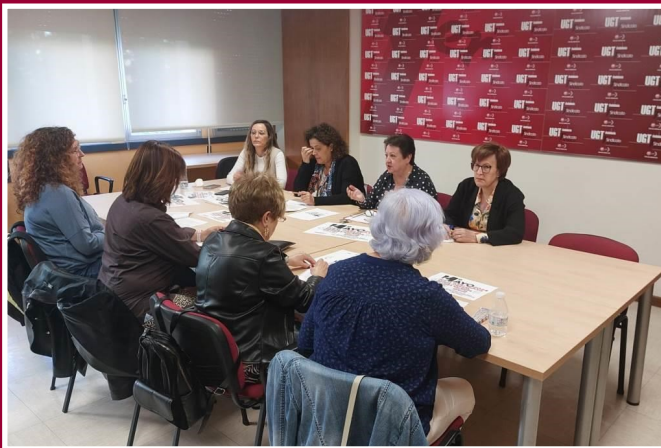
COMISIÓN DE IGUALDAD Y FEMINISTAS 8M