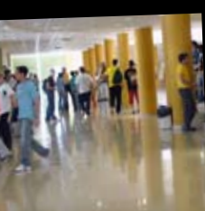
ad de Jaén