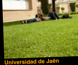
Universidad de Jaén