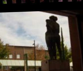
Universidad de Jaén