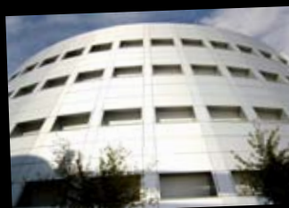
Universidad de Jaén