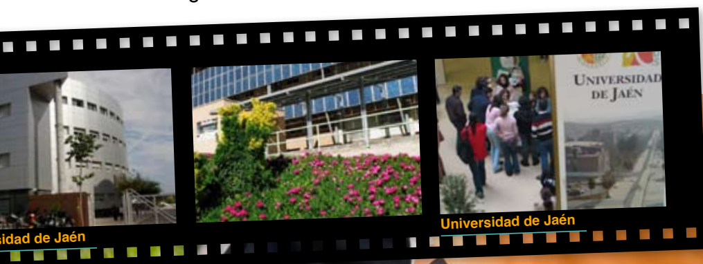
Universidad de Jaén