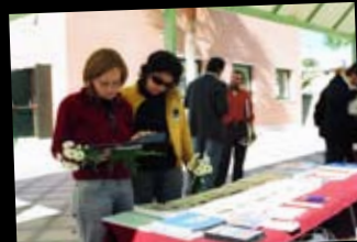
Universidad de Jaén