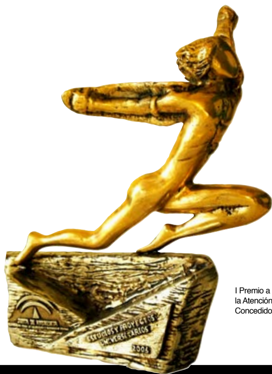
I Premio a las Buenas Prácticas en la Atención a la Discapacidad. Concedido por el Gobierno Andaluz.