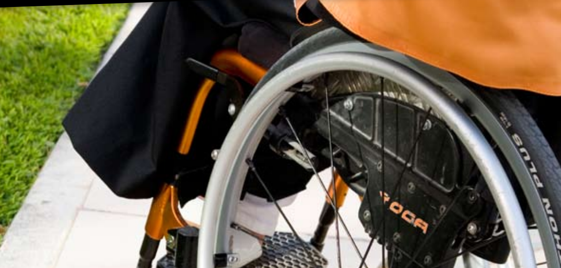
Universidad de Jaén