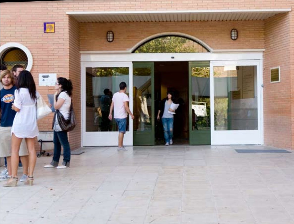
Universidad de Jaén