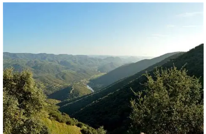
Imagen de un paisaje típico de Sierra Morena.

Los iconos que aparecen en la pantalla del móvil o la tableta son apps.