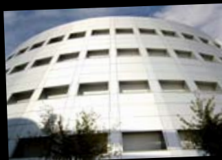
Universidad de Jaén