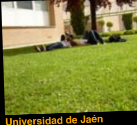
Universidad de Jaén