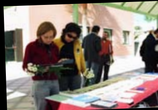
Universidad de Jaén