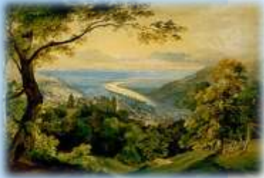
Heidelberg - Carl Rottmann, 1815

Ya sea con el casco antiguo de Heidelberg o con el castillo, uno se encuentra en cada rincón con un poco de historia. La ciudad, con la universidad más antigua de Alemania (fundada en 1386), se remonta a una historia de 800 años . En este tiempo la ciudad atrajo a poetas como Goethe, Eichendorff y Mark Twain; artistas conocidos como Turner, Fohr y Trübner se dejaron inspirar por sus coloridas impresiones; y compositores como Brahms, Schumann o Carl Maria von Weber